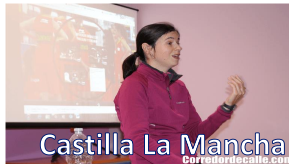
Castilla La Mancha