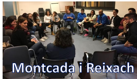
Montcada i Reixach